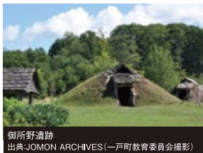
御所野遺跡