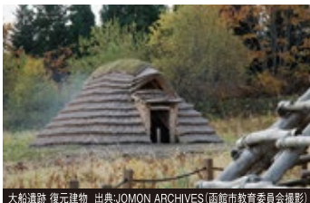
大船遺跡 復元建物