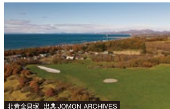
北黄金貝塚