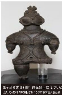
亀ヶ岡考古資料館 透光器土偶(レプリカ)