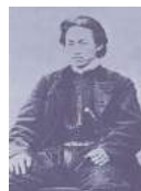
土方歳三

今から150年前、箱館戦争で五稜郭を占拠した旧幕府軍。その中でも最も有名な人物が新選組副長の土方歳三です。彼は箱館戦争で銃弾により戦死をしましたが今もなお、多くの旅人が彼の軌跡を辿り五稜郭へと足を運びます。この旅では、そんな土方歳三たちにスポットをあて歴史ガイドと共に五稜郭を始め150年前の箱館戦争で散った志士たちの足跡をめぐる。桜のつぼみが膨らむ時期、道南の史跡めぐりをお楽しみ下さい。