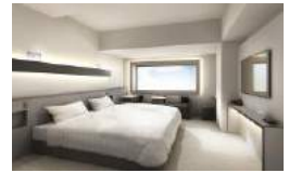
自慢の天空露天風呂とお部屋イメージ