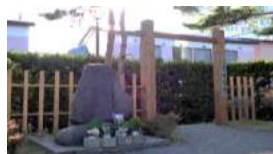
土方歳三最期の地碑