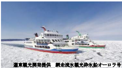
網走流氷観光砕氷船オーロラ号