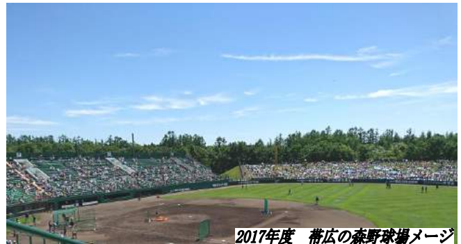
2017年度 帯広の森野球場メージ

道新観光の日本ハムファイターズ 応援バスツアーは、多くのお客様 に支えられて9年目をむかえます。