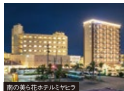
南の美ら花ホテルミヤヒラ