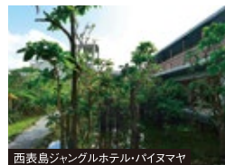
西表島ジャングルホテルバイヌマヤ