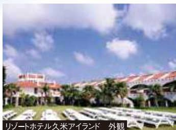
リゾートホテル久米アイランド 外観