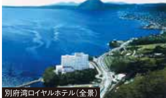
別府湾ロイヤルホテル(全景)