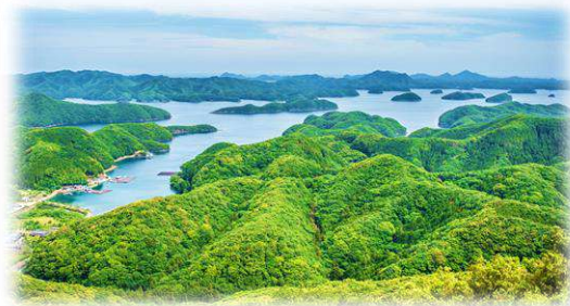
3日目: 対馬 烏帽子岳からの展望イメージ

お申込み前に裏面の旅行条件ならびに「新型コロナウイルス感染拡大防止に伴うお客様へのお願い」をご一読下さい