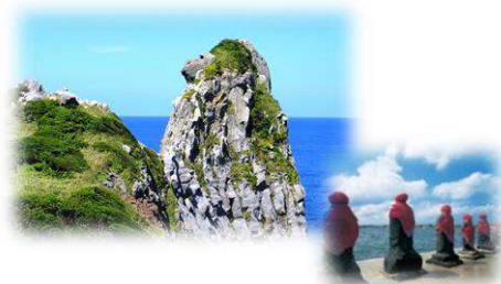
2日目: 壱岐 猿岩とはらほげ地蔵

●下車入場観光 ○下車観光 =貸切バス ~フェリー又は高速船 ⇒飛行機 ...徒歩