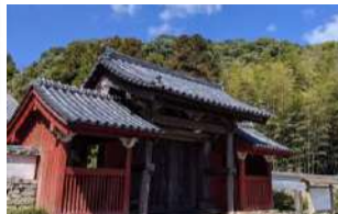
3日目: 対馬 万松院山門

高さ45Mの岩はそっぽを向いた猿の姿に そっくりと言われてます。 胸の部分に穴が空いている六体の地蔵は、 「はらほげ地蔵」と呼ばれ、遭難した海 女や鯨の供養のために祀られていると伝 わっております。