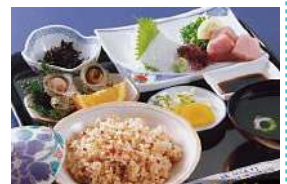
2日目昼食: 壱岐島 うにめし定食イメージ

うにめし食堂「はらほげ」は、 昭和47年に創業した『壱岐で 唯一の郷土料理屋』です。 海女さんが、玄海灘よりお届け する「うに」は香り、甘み とともに豊かで、「うにめし」 は紫うにと馬糞うにそして 赤うに、三種類のうにを炊き 込んだオリジナルの料理です。