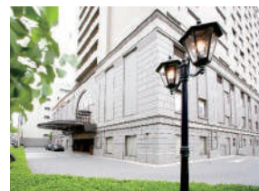
ホテル日航プリンセス京都