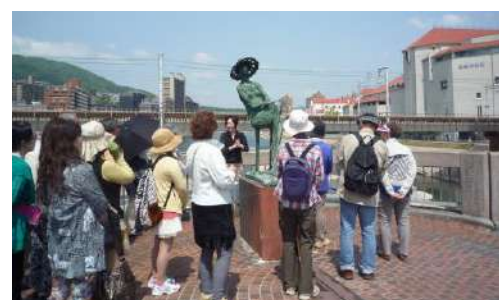
元タカラジェンヌによる街歩き