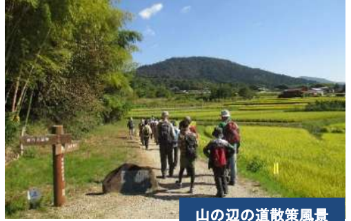
山の辺の道散策風景

■添乗員同行(全行程) ■食事(3朝食・4昼食・3夕食)付 ■利用バス会社:天理交通 ■募集人員/35名様(最少催行人員/15名様) ◎2・3日目:現地ガイド付 <ご宿泊ホテル>