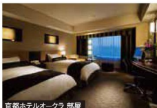
京都ホテルオークラ 部屋