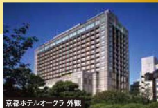
京都ホテルオークラ 外観

1888年創業の歴史をもつ落ち着いたたたずまい。京の風情とヨーロッパアンティークが調和する、落ち着いたやすらぎに満ちたクラシックな雰囲気を持つ、京都を代表するホテルに宿泊します。また中心に位置するため、大河ドラマで話題の本能寺やにぎやかな先斗町なども徒歩圏内。散策もお楽しみいただけます。