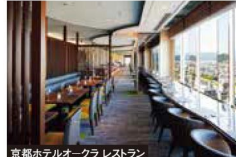
京都ホテルオークラ レストラン