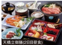
天橋立御膳(2日目昼食)

京都府北部の丹後半島や舞鶴など、京都中心部から離れた歴史の舞台を訪れます。またローカル線の乗車や丹波の紅葉の名所、丹波焼の窯元など、見どころへご案内。