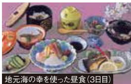
地元海の幸を使った昼食(3日目)