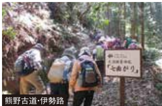
熊野古道・伊勢路