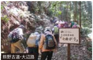
熊野古道・大辺路