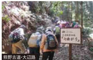
熊野古道・大辺路