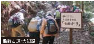
熊野古道・大辺路