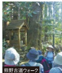
熊野古道ウォーク