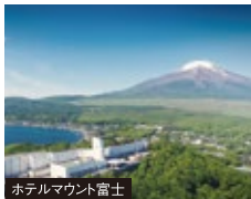
ホテルマウント富士

富士山を間近に眺めながらガイドの案内で山麓のトレッキングを楽しめます。富士山の自然、歴史や富士山信仰など広く富士山に触れていきます。富士山を囲むように静岡県・山梨県を周遊し、様々な角度から富士山の雄姿を眺めます。