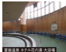
富嶽温泉 ホテル花の湯 大浴場

富士山と山中湖を一望できるリゾートホテル。山中湖は日本三大野鳥生息地のひとつです。中庭から続く遊歩道では一年を通して野鳥観察を楽しめます。例年10月中旬~11月中旬が山中湖周辺の紅葉シーズンです。