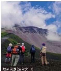
散策風景(宝永火口)