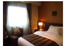
松本丸の内ホテル (左写真/外観) (上写真/客室一例)