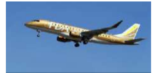
フジドリームエアラインズ 機影(イメージ)