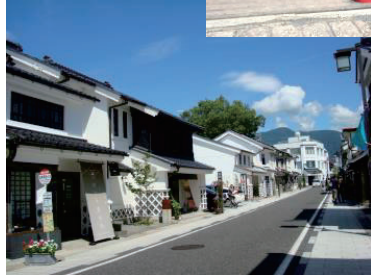
中町通り(目的地イメージ)