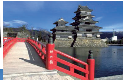
松本城(目的地イメージ)

7か所の提携店で使える500円相当のチケットをホテルチェックイン時にお一人様一枚プレゼントします。