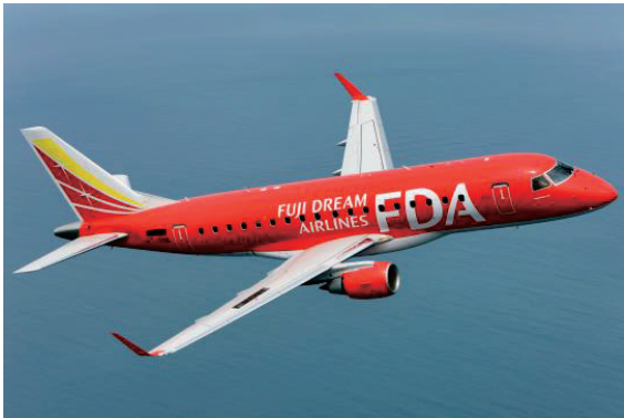
フジドリームエアラインズ(イメージ)