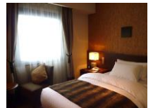
松本丸の内ホテル (左写真/外観) (上写真/客室一例)