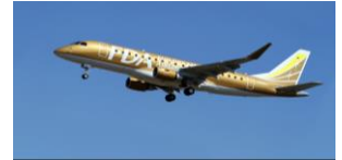
フジドリームエアラインズ 機影(イメージ)