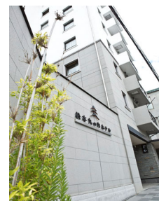
松本丸の内ホテル（外観）

松本市内でも唯一、城内(三の丸)に位置するホテルで、国宝松本城天守までは徒歩2分。周辺散策にも便利です。