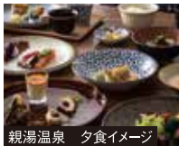
親湯温泉 夕食イメージ

大正15年創業の渓谷の隠れ家的な一軒宿。畳敷きのお座敷風呂や渓流露天風呂が自慢です。