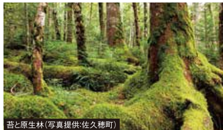
苔と原生林