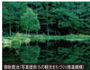
御射鹿池

標高2,100m以上の湖としては日本最大の自然湖・白駒の池。ハケ岳を望むこの地には、数百年の時をその年輪に刻んだ原生林が広がり、地面を覆うのは520種類にも及ぶ苔の絨毯です。当ツアーでは地元ガイドの案内で自然散策を楽しみます。