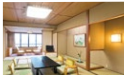
あえの風客室一例