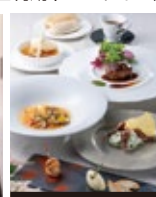
富山エクセルホテル東急 洋風会席