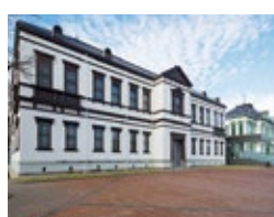
国立工芸館(外観)