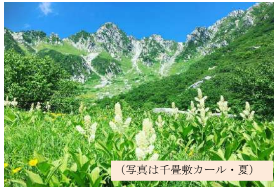
(写真は千畳敷カール・夏)

【千畳敷カール】今から約2万年前に、氷河のゆったりとした流れにより浸食されて形成されたカール(半円形の窪地)で、畳を1,000枚敷いた広さがあることから「千畳敷カール」と呼ばれています。