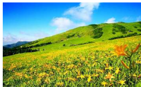
(写真は車山高原 ニッコウキスゲの群生)

【凡例】 -〇-航空機 ==バス +++ロープウェイ・リフト .....徒歩 ●下車入場 ○下車観光 < 分>滞在時間の目安 食事:×は各自