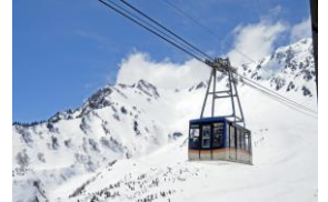
立山ロープウェイ