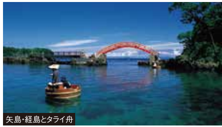
矢島・経島とタライ舟

佐渡配流の日蓮に仕え、熱心な法華経信者となった遠藤為盛(阿佛房日得上人)。1278年、妻の千日尼と共に自宅を寺として開いたのが始まりと伝わります。かつては佐渡守護代竹田本間氏の居城で、かつての城跡の雲間気を残しています。