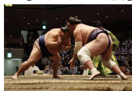
照ノ富士 vs 御嶽海

中村梅玉、中村魁春、中村鷹治郎、 中村扇雀、中村芝翫、片岡孝太郎、 松本幸四郎、中村獅童、中村勸九郎、 中村七之助 他