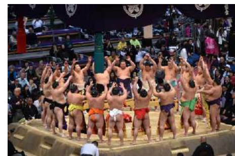
幕内土俵入