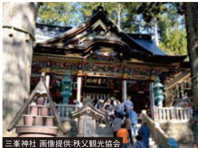
三峯神社