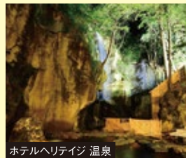
ホテルヘリテイジ 温泉