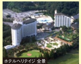
ホテルヘリテイジ 全景