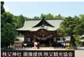
秩父神社

開運祈願で人気の秩父三社を現地ガイドの解説付きでめぐります。最終日には、ドラマでも話題の渋沢栄一ゆかりの深谷を訪ねます。