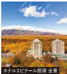
ホテルエピナール那須 全景

ご宿泊ホテル 1・2日目/那須高原: ホテルエピナール那須 洋室または和洋室利用(バス・トイレ付)