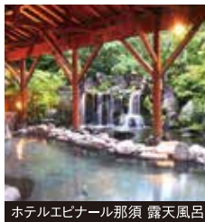
ホテルエピナール那須 露天風呂