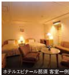
ホテルエピナール那須 客室一例