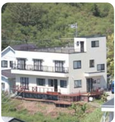
ペンションクレセント(全景)