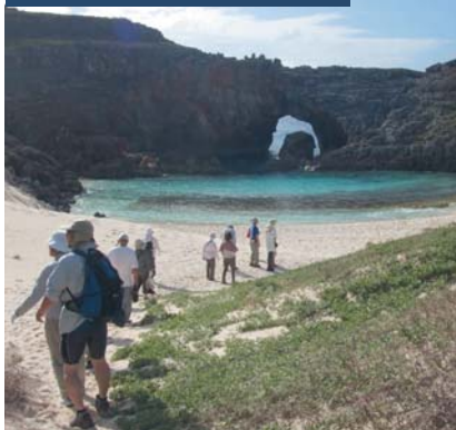
父島列島・南島(扇池)