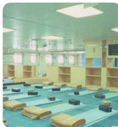
おがさわら丸(2等客室)