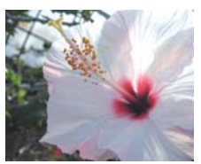
白いハイビスカス(イメージ)

現地の宿泊施設は、小規模の民宿やペンションがほとんどです。ツアー参加人数により複数の宿泊施設に分かれてご宿泊いただく場合があります。食事内容、客室条件、浴衣や洗面用具類の備え付け状況は施設により異なります。詳しくは最終日程表にてご案内いたします。 ●上記以外の利用対象施設 (いずれも洋室または和室/バス・トイレ付) 父島:バンブーイン、ペンションのあ、ペンションポートロイド、ペンション海渡 ※バンブーイン及びポートロイド利用の場合、食事は館外施設でのご用意となります。 ※ご利用施設の確定内容は最終日程表にてお知らせいたします。