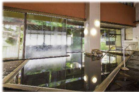
駒ヶ岳グランドホテル大浴場