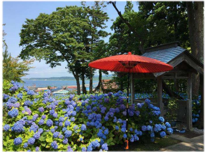
雲昌寺のアジサイ