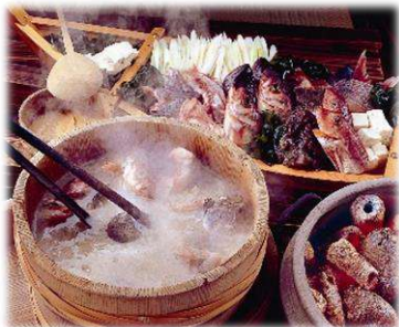
男鹿観光ホテル: 石焼料理

秋田県男鹿市、雲昌寺副住職が十五年も天塩にかけて育てたアジサイは満開の時には境内を蒼で埋め尽くします。夜のライトアップされた景色と、朝露残る特別拝観で空・海・アジサイの蒼のコントラストを体感してください。2日目にはツアーのお客様だけで1輛貸切った秋田縦貫鉄道に乗り、深緑の八幡平を眺めながら田沢湖へ。アテンドの話を聞きながら、田んぼアートや、渓谷などローカル列車ならではの風景をお楽しみいただけます。