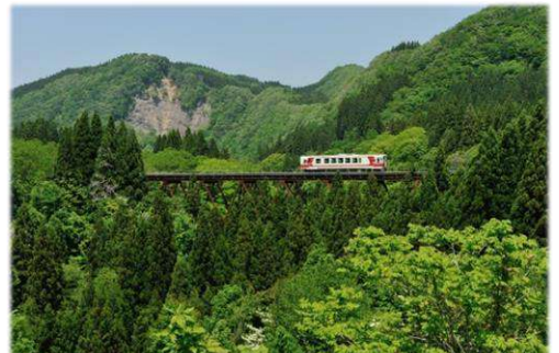
渓谷を走る秋田内陸縦貫鉄道

お申込み前に裏面の旅行条件ならびに「新型コロナウイルス感染拡大防止に伴うお客様へのお願い」をご一読ください。