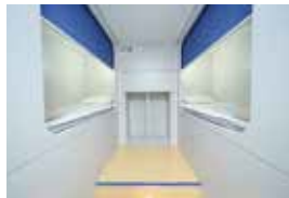
新日本海フェリーデラックスルームA