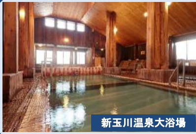
新玉川温泉大浴場