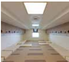
シルバートピアエイト2等室