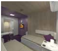
シルバートピアラ1等