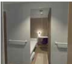
シルバートピアラ2等寝台A

■ご宿泊ホテル 1日目/川崎近海汽船・シルバートピアラ 2日目/川崎近海汽船・シルバートピアエイト