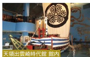
天領出雲崎時代館 館内

出雲崎は江戸幕府の財政を支える佐渡金銀荷揚げ港として、代官所が置かれた幕府直轄の天領地。また近代石油産業発祥の地でもあります。天領時代に興味のある方は「天領出雲崎時代館」は必見です。他に良寛記念館なども見学。昼食予定：寺泊にて新鮮な海の幸の膳